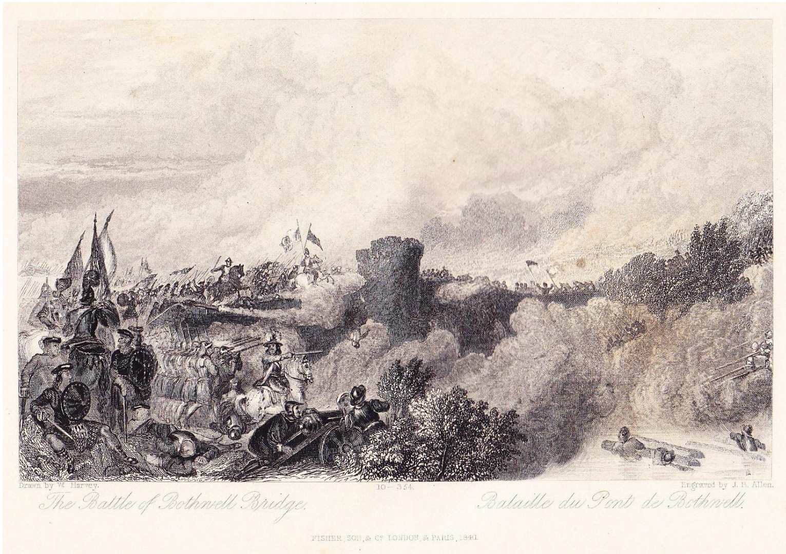
« bataille du pont de Bothwell / the battle of Bothwell bridge », in « Contes de mon hôte = Old mortality »